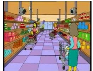
La distribution et la commercialisation