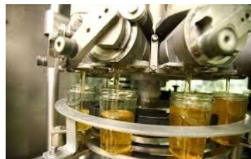
Le négoce et le conditionnement