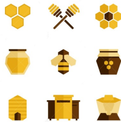
Les fabricants et les revendeurs de matériel